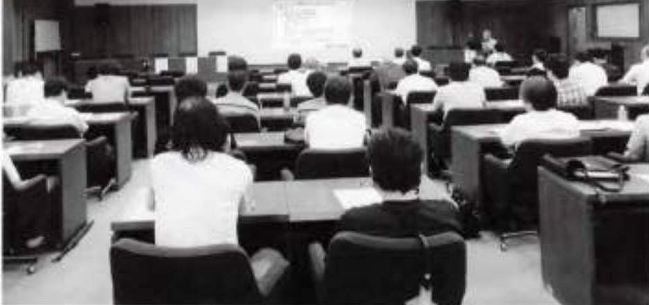
会場は、どのよう職場として受入して

5S活動を進めれば良い方向性が見いだせず、苦悶したが、実践現場と目撃して不要な物の撤去など改善活動が進んだと報告した。続いて、味まるは食品足利工場(高田町/食品製造加工業)の大和田工場長が発表、平成26年に5Sネットワーク工場見学会への参加がきっかけとなり、平成27年にインストラクター養成講座の実践現場として受入を開始した。