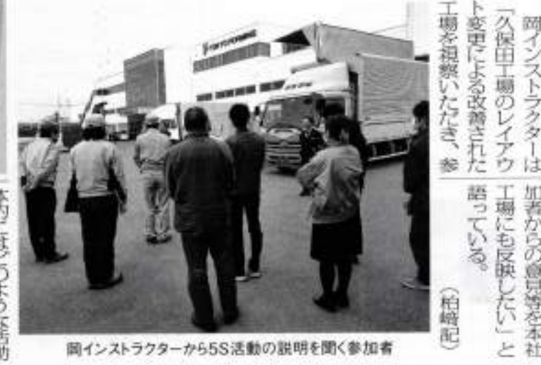
岡インストラクターから5S活動の説明を聞く参加者

足利5S学校では、このほどPRチラシとポスターを10年振りにリニューアルし、同校会員事業所等に配布した。「足利流5S」が具へ連絡を。(柏崎記)