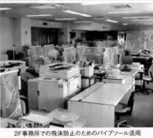
2F事務所の飛沫防止のためのパイプツール活用

災害時に威力を発揮5S活動 パイプツールとビニールシートで飛沫防止 足利商工会議所は、事務所の新型コロナウイルス感染症防止策として、職員間の飛沫防止にパイプツールを使ってビニールシートを張り予防に努めている。パイプツールは、材料棚や作業台の作成に使用するもので、5S改善活動には欠かせないグッズを得ている。(柏崎記)