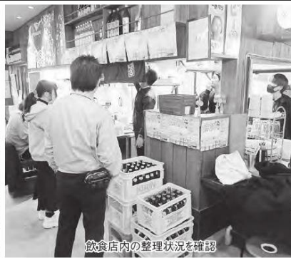
飲食店内の整理状況を確認

③従業員20人以下の小規模事業者の場合 ④支援初年度のみ年間6回まで無料支援を受ける。費用はすべて5S学校の負担とする。2年目以降は、企業費とする。 ⑤従業員21人以上の事業所の場合 ⑥支援初年度のみ年間6回まで支援を受ける。費用は4回分を5S学校負担とし、回分は1回につき1万円を企業負担とする。 ⑦2年目以降は、企業費とする。過去の同制度の支援を受けた事業所は対象外。 ⑧先着10社限定(上記③と④両方で10社) ⑨具体的に効果があった主な意見 ・シンプルで分かりやすい ・全員が取り組め、成果が目に見えてわかる点が良い。