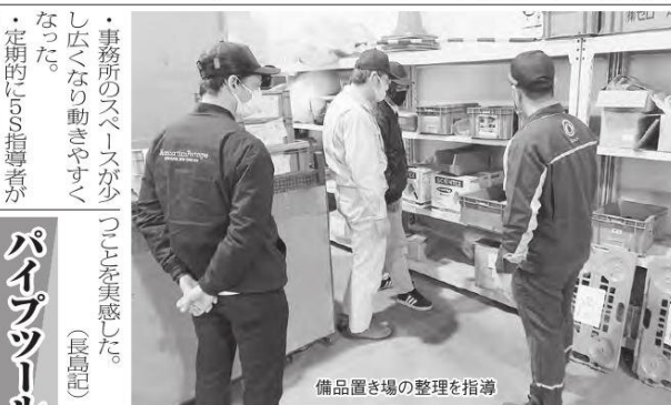
備品置き場の整理を指導

・事務所のスペースが少し広くなり動きやすくなった。 ・定期的にS指導者が訪問することで、前月より少しでも改善しようという気持ちに変わった。 ・パイプツールの活用による生産アップ、改善を実感している。 ・繰り返して5S活動が定着してきたように思う。 ・製品を置きかたがたになかったことで、台風被害から最小限に被害を止めることができた。5S活動は、防災対策にも役立つ。